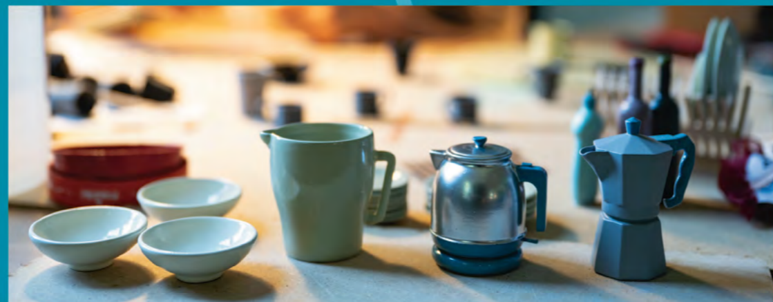
LA RÉALISATION DES ACCESSOIRES